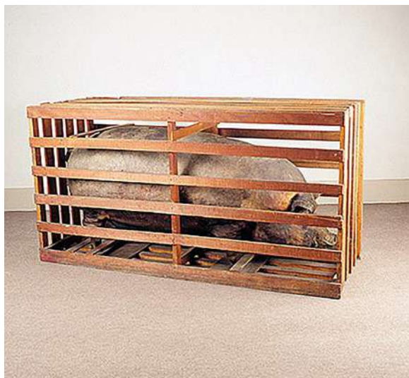
O Porco, 1966. Porco empalhado em engradado de madeira. Acervo da Pinacoteca do Estado de São Paulo/Brasil. (Disponível em: https://enciclopedia.itaucultural.org.br/obra5980/o-porco . Acesso em: 11 ago. 2024).

Sobre essa imagem, é CORRETO afirmar que: