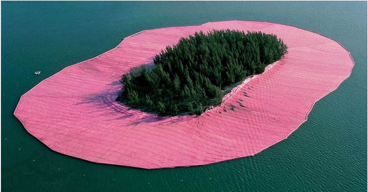
Christo and Jeanne-Claude, Surrounded Islands , 1980-83 (vista aérea).

A imagem abaixo é uma criação dos artistas Christo e Jeanne-Claude, chamada Surrounded Islands (1980-83). Esse trabalho faz parte de uma tendência de arte contemporânea conhecida pelos nomes de Land art ou Earth art .