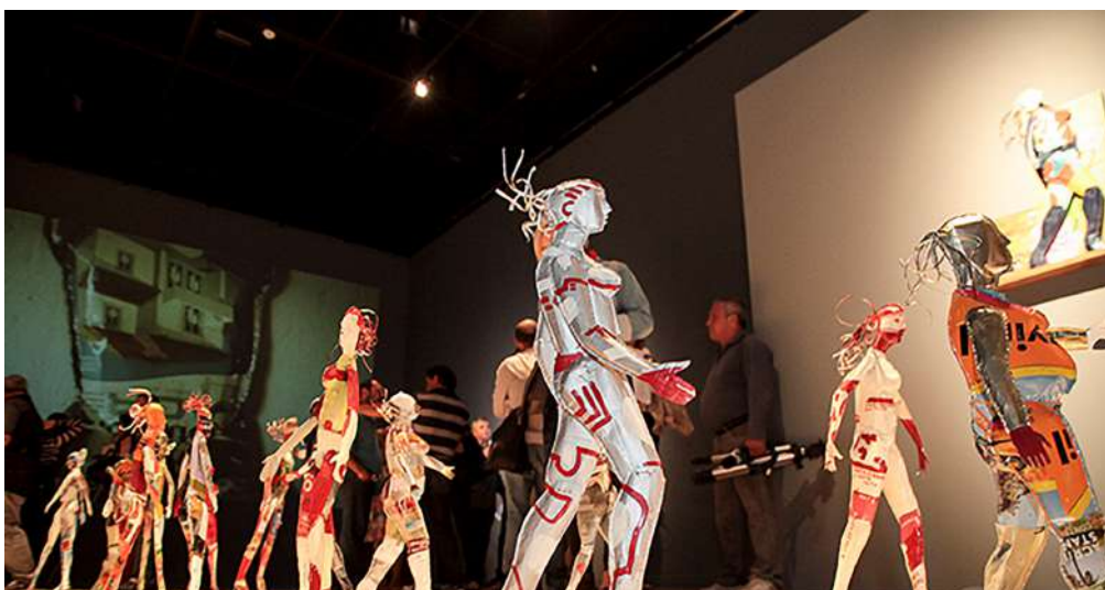
Exposição "Orifício", Galeria SESC Arsenal, Cuiabá, MT, 2014. (Disponível em: https://www.premiopiqa.com/ . Acesso em: 16/08/2024. Acesso em: 16 ago. 2024).