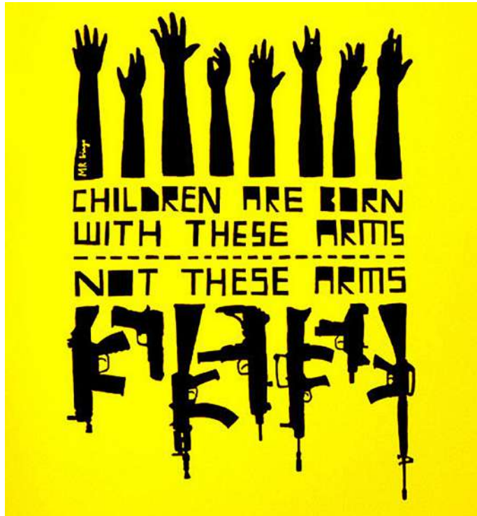
Imagem de propaganda antibelicista. Mr. Bingo. 2007. (Disponível em: https://unmiss.unmissions.org/children-not-soldiers-%E2%80%98abducted-14-be-child-soldier-we-faced-hunger-ate-leaves%E2%80%99 . Acesso em: 05 set. 2024).

De acordo com os fundamentos da linguagem visual, na ilustração publicitária ao lado, podemos identificar as seguintes relações entre os elementos visuais: